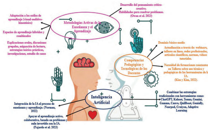
Gráfico. 4. Triangulación de los Datos.

Por último, la tercera categoría referente a “las competencias pedagógicas y tecnológicas de los docentes”, que muestra como los docentes tienen de un manejo básico a medio en las herramientas de las IA, siendo necesario desde las perspectivas del profesorado las formaciones a través de Talleres formales desde el Instituto. Sin embargo, la integración que han logrado hasta ahora ha sido desde la disposición y autoformación; por esta razón la relevancia de garantizar capacitaciones para garantizar la calidad educativa. Lo anteriormente explicado se puede representar en el siguiente gráfico 4: