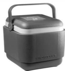
GIOSTYLE 8 pilas o frigos