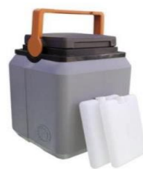
KST 4 frigos o pilas