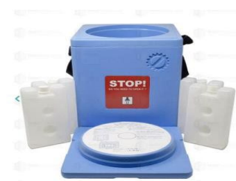
BCVC-46 4 frigos o pilas